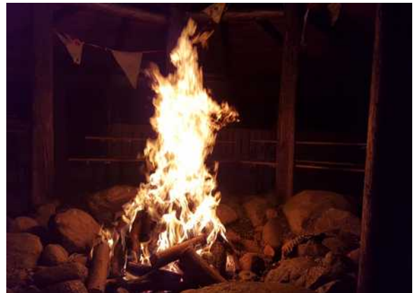
mit Lagerfeuerstelle in der Mitte