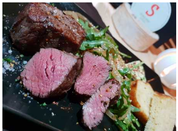
Steak vom kanadischen BISON

Unsere Rondelle (überdachte Feuerstellen) können Sie für Feiern mieten, Bierzeltgarnituren, Strom und ein Kühlschrank inklusive - Rondell für 30 Personen: 30.00 €/ Tag und Rondell für 100 Personen: 45,00 €/ Tag (je exklusive Feuerholz)