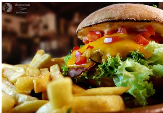
besonders beliebt: unsere hausgemachten Burger

Wir empfehlen im Vorfeld einen Tisch zu reservieren. Weitere Infos finden Sie unter: www.zum-indianer.de