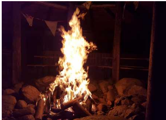
mit Lagerfeuerstelle in der Mitte