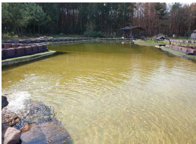
Naturbadeteich nur für unsere Camper

Campingwagen oder Zelt bei uns gegen Tagesgebühr von 1.00 € stehen lassen und bei Belegung normale Touristikcamperpreise bezahlen.