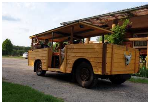
der „hölzerne Büffel“