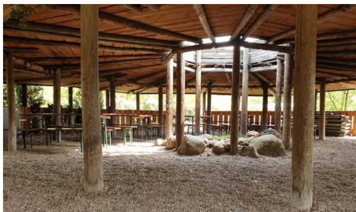
unser großes Rondell

Unsere Rondelle (überdachte Feuerstellen) können Sie für Feiern mieten, Bierzeltgarnituren, Strom und ein Kühlschrank inklusive - Rondell für 30 Personen: 30.00 €/ Tag und Rondell für 100 Personen: 45,00 €/ Tag (je exklusive Feuerholz)