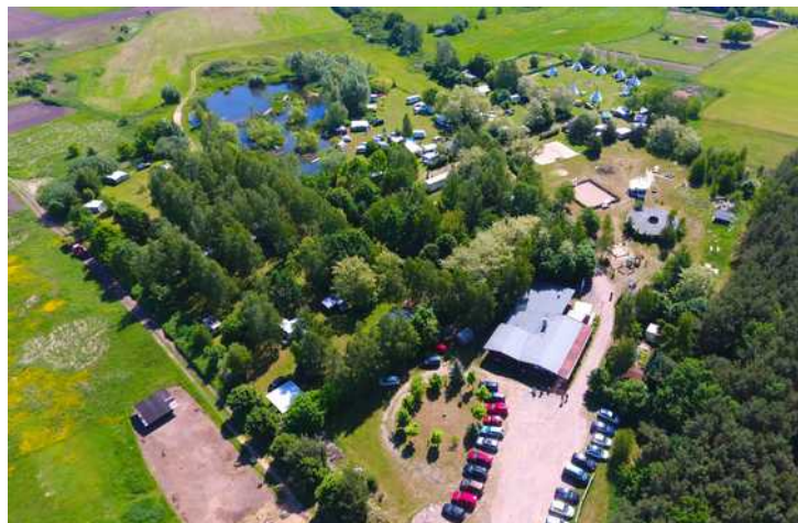
Luftbild vom Campingplatz