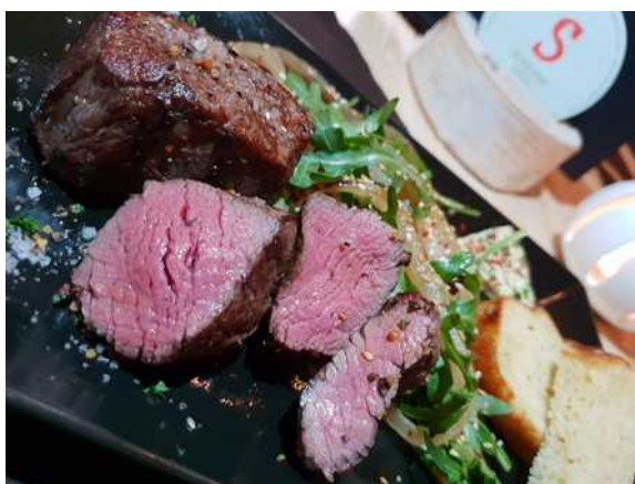
Steak vom kanadischen BISON

Unsere Rondelle (überdachte Feuerstellen) können Sie für Feiern mieten, Bierzeltgarnituren, Strom und ein Kühlschrank inklusive - Rondell für 30 Personen: 30.00 €/ Tag und Rondell für 100 Personen: 45,00 €/ Tag (je exklusive Feuerholz)