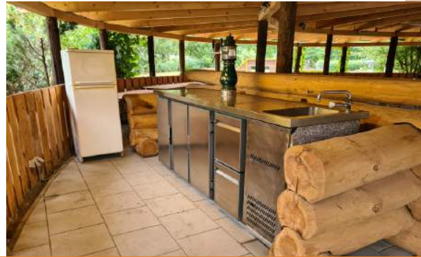
Große Rondell - Platz für 100 Personen mit Tresen zum Getränkekühlen